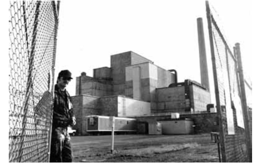
Le premier réacteur nucléaire à produire du plutonium

Le Regroupement pour la surveillance du nucléaire Les Professionnel(le)s de la santé pour la survie mondiale Le Mouvement vert Mauricie.