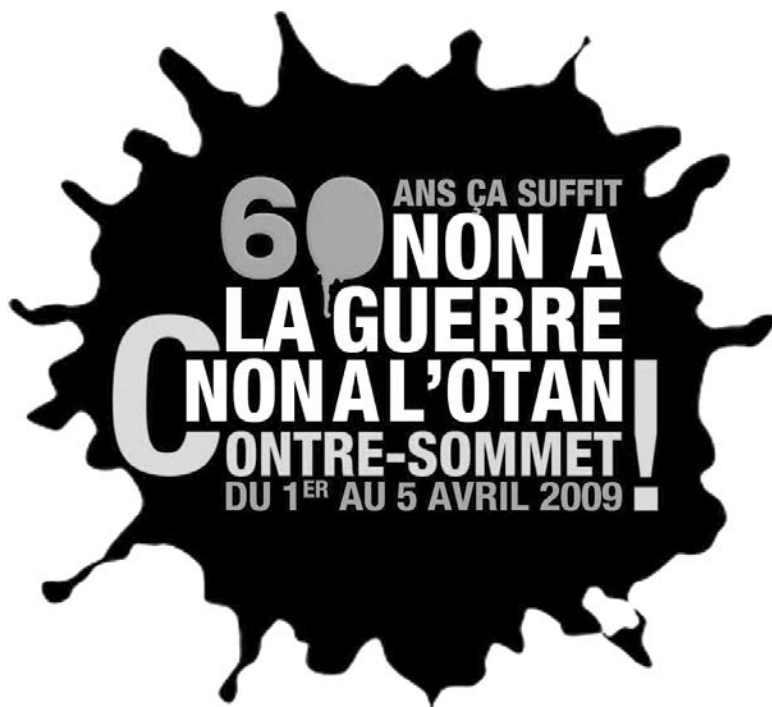
Logo du contre-sommet qui a eu lieu à Strasbourg, France du 1er au 5 avril 2009.

En fait, l'OTAN est au cœur même de politiques et de procédés qui vont à l'encontre de rapports égalitaires entre pays, fondés sur le respect du droit international. Pour être conséquente, notre opposition à la guerre d'occupation en Afghanistan et au virage militariste de la politique étrangère canadienne doit s'accompagner de l'exigence du retrait du Canada de l'OTAN, qui est le véritable maître d'œuvre de ces politiques guerrières et anti-démocratiques.