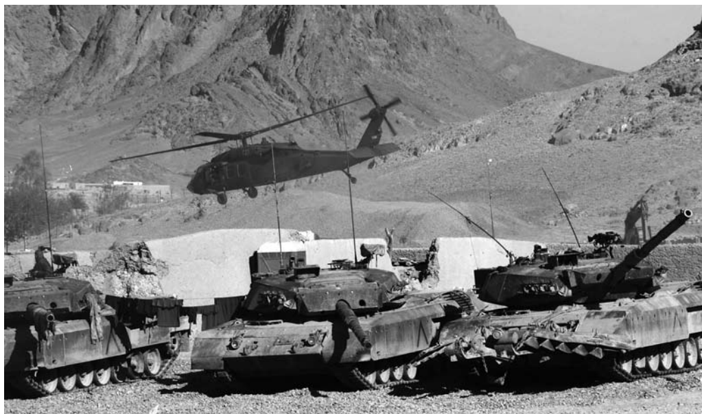
Des blindés canadiens « Léopard C2 » et leur équipage en attente pendant qu'un hélicoptère Blackhawk décolle de la base Ma'Sum Ghar près de la ville de Bazaar-e-Panjwayi.

Tiré de NATO at 60 years , Alliance Canadienne pour la Paix (notre traduction)